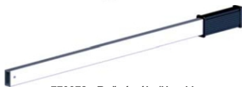
770078 - Ručná páka/Hand lever

Dvojčinné ručné pumpy (pumpa dodáva olej pomocou tlačenia a ťahania páky) vhodné na prevádzku jednoúčelových aplikácií. Môžu byť namontované na nádrž a sú vybavené skoseným spúšťacím ventilom. Sú k dispozícii v 3 rôznych veľkostiach, ktoré umožňujú rôzne aplikácie a pre obmedzenie zaťaženia na páke v každej situácii. Majú zinkované liatinové teleso s tesnením a poniklovanú cievku.